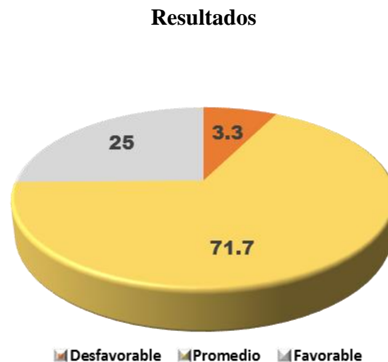
Figura 1. Resultados de la percepción del clima social familiar de los estudiantes

Con el propósito de efectuar el análisis estadístico se utilizó el Software SPSS versión 22, donde se sistematizaron los resultados mediante figuras. Asimismo, el contraste de hipótesis fue realizado usando el estadístico rho de Spearman puesto que las variables tenían un nivel de medición ordinal y no cumplían con el supuesto de normalidad.